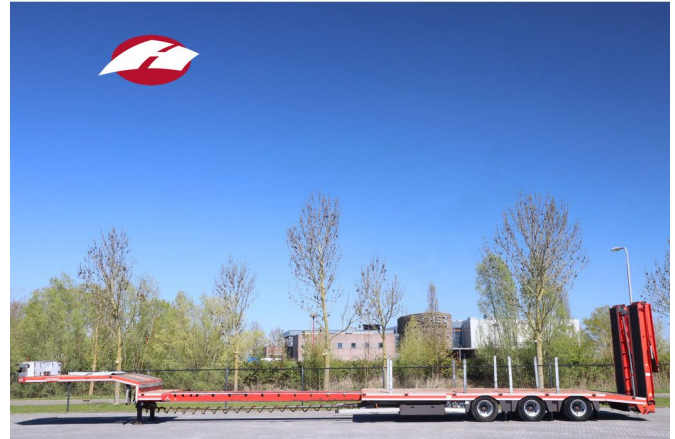
Nooteboom OSDS-48-03-V | 6-MTR EXTENSION | WINCH | ...