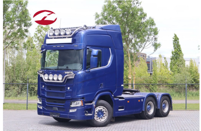
Scania R650 V8 NGS | 6X4 | BIG AXLES | RETARDER | HY...