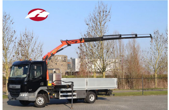
DAF LF 210 | 4X2 | PALFINGER PK5001 | REMOTE | 48.000...