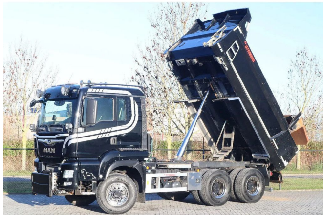
MAN TGS 26.500 | 6X6 | HYDRODRIVE | BIG AXLES | EURO 6