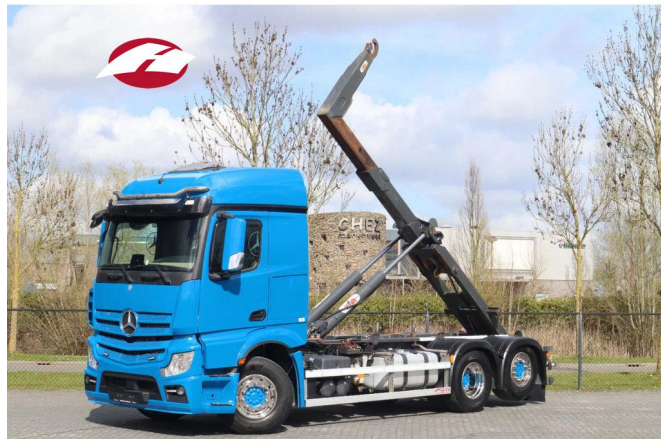
Mercedes-Benz Actros 2653 6X2 | RETARDER | HYVA HOO...