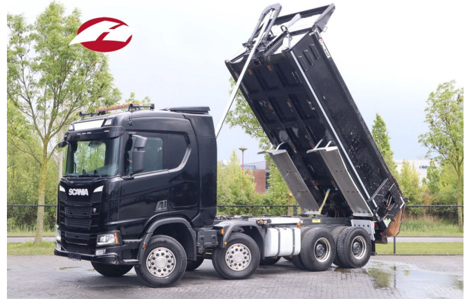
Scania R500 NGS | 8X4 | RETARDER | BIG AXLES | EURO 6