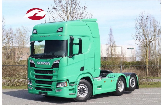
Scania R580 V8 NGS 6X2 | RETARDER | HYDRAULICS | E...