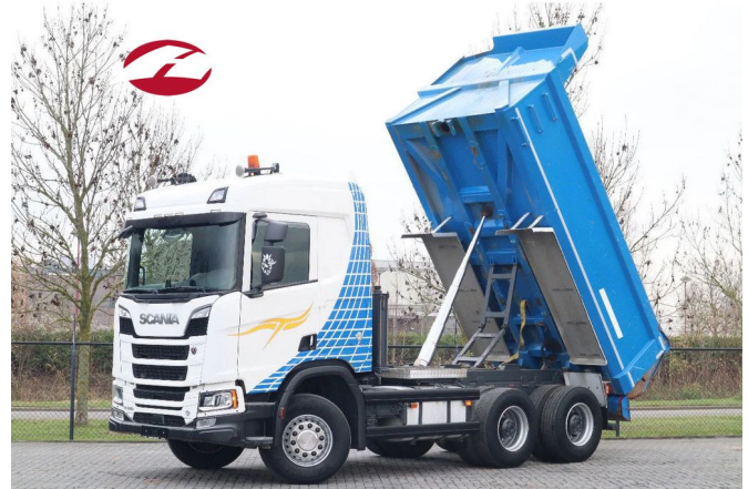
Scania R580 V8 NGS 6X4 | FULL STEEL | RETARDER | E...