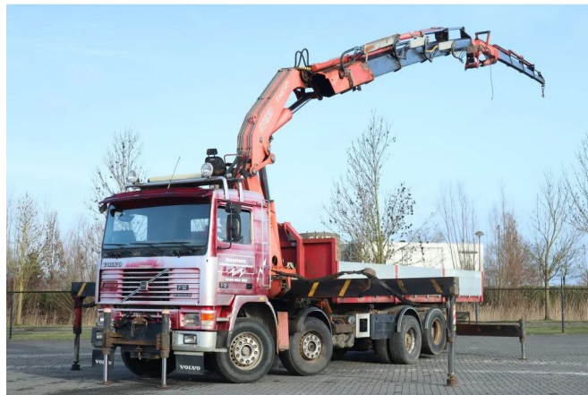
Volvo F 12.400 8X2 FASSI F600XP.24 WITH JIB