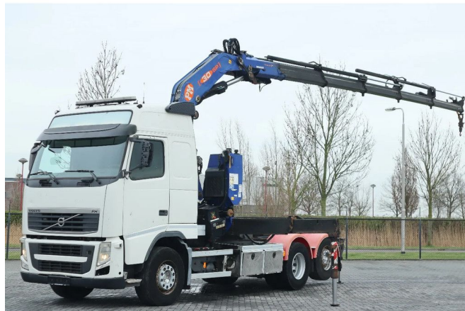
Volvo FH 500 EURO 5 CABLE/CRANE PM 30