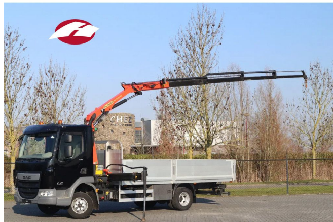
DAF LF 210 | 4X2 | PALFINGER PK5001 | REMOTE | 48.000...