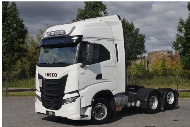
Iveco S-WAY 570 6X2 | RETARDER | EURO 6