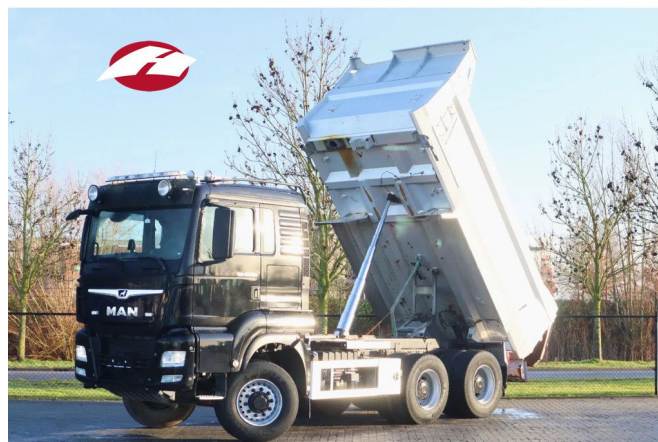
MAN TGS 26.500 6X4 | 6X6 | HYDRODRIVE | BIG AXLES | ...