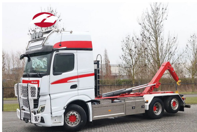
Mercedes-Benz Actros 2563 | 6X2 | MULTILIFT HOOK | RET...