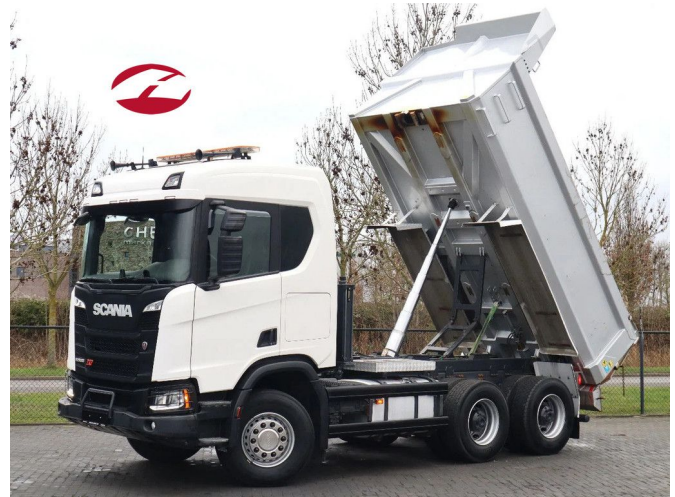
Scania R500 NGS XT | 6X4 | 216.000 KM | FULL STEEL | RE...