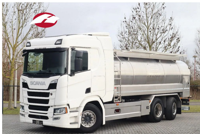
Scania R540 NGS | 6X2*4 | RETARDER | ISOLATED | 15.00...