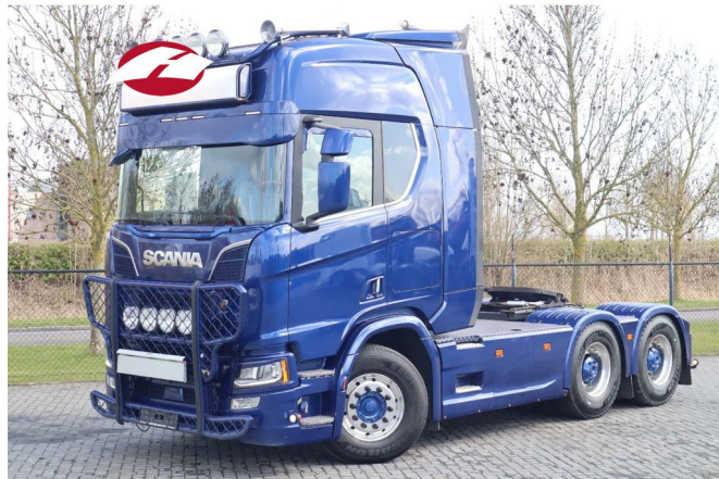
Scania R730 V8 NGS | 6X4 | 100 TON | RETARDER | BIG AX...