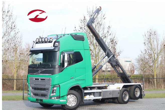
Volvo FH 16.750 6X2 | RETARDER | JOAB HOOK | EURO 6