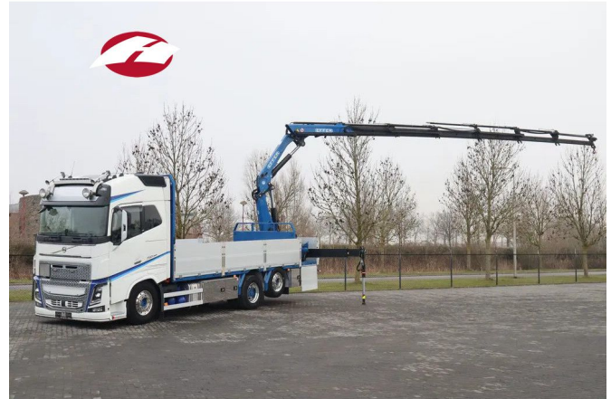
Volvo FH 16.750 | 6X2*4 RETARDER EFFER 215-6 DEMOU...