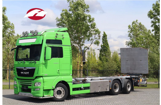
MAN TGX 26.640 | 6X2*4 | RETARDER | BDF | LOW KM | E...