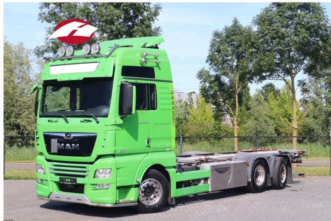
MAN TGX 26.640 | 6X2*4 | RETARDER | BDF | STEERING ...