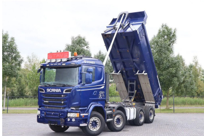
Scania R580 V8 | FULL STEEL | BIG AXLES | RETARD... 8x4